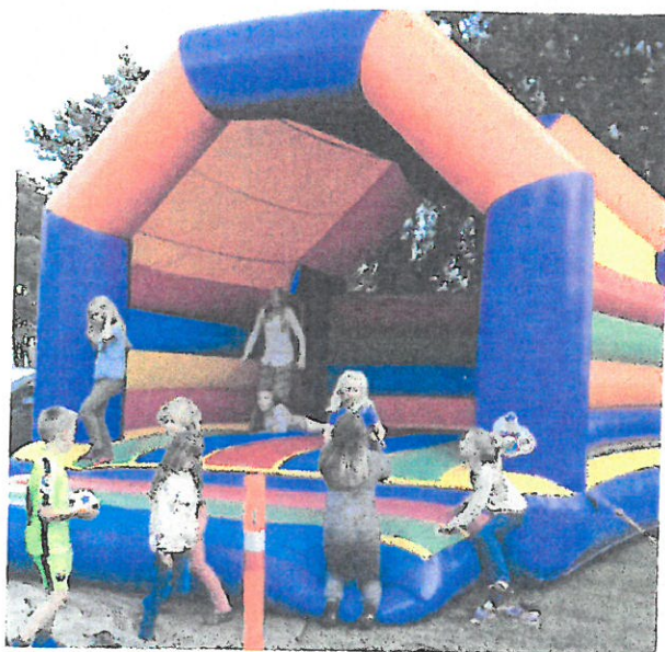
Børn i hoppeborgen.

Vi stiller teltet op fredag den 15. juli 2016 kl. 17. Hvis du har mulighed for at give en hånd med, vil vi være meget glade for det, da det ofte er nogle få stykker der må tage hele slæbet.