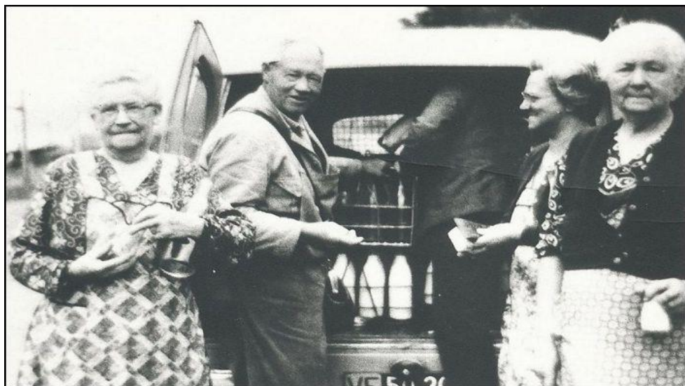
MælkeRas med nogle af områdets fruer ca. 1955