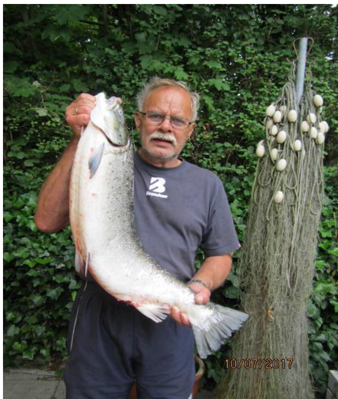
Årets fangst i Begtrup Vig